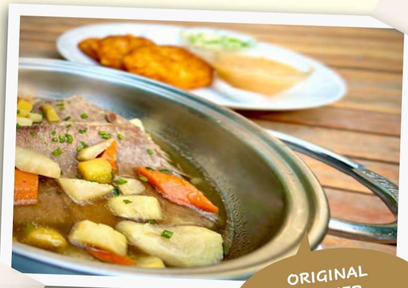
ORIGINAL WIENER TAFELSPITZ